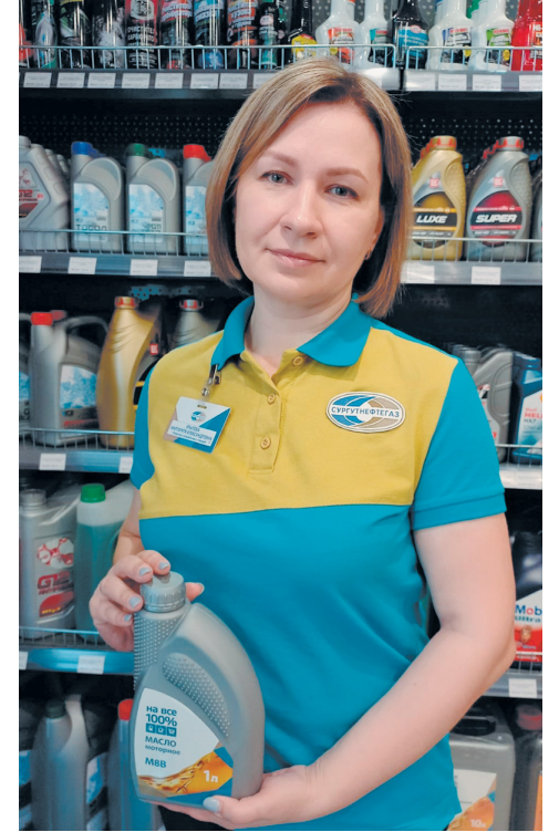
Сотрудники станции часто предлагают товары под собственным брендом «На все 100%»

Начало работы на автозаправочной станции она помнит хорошо и по сей день добрым словом отзывается о своей наставнице