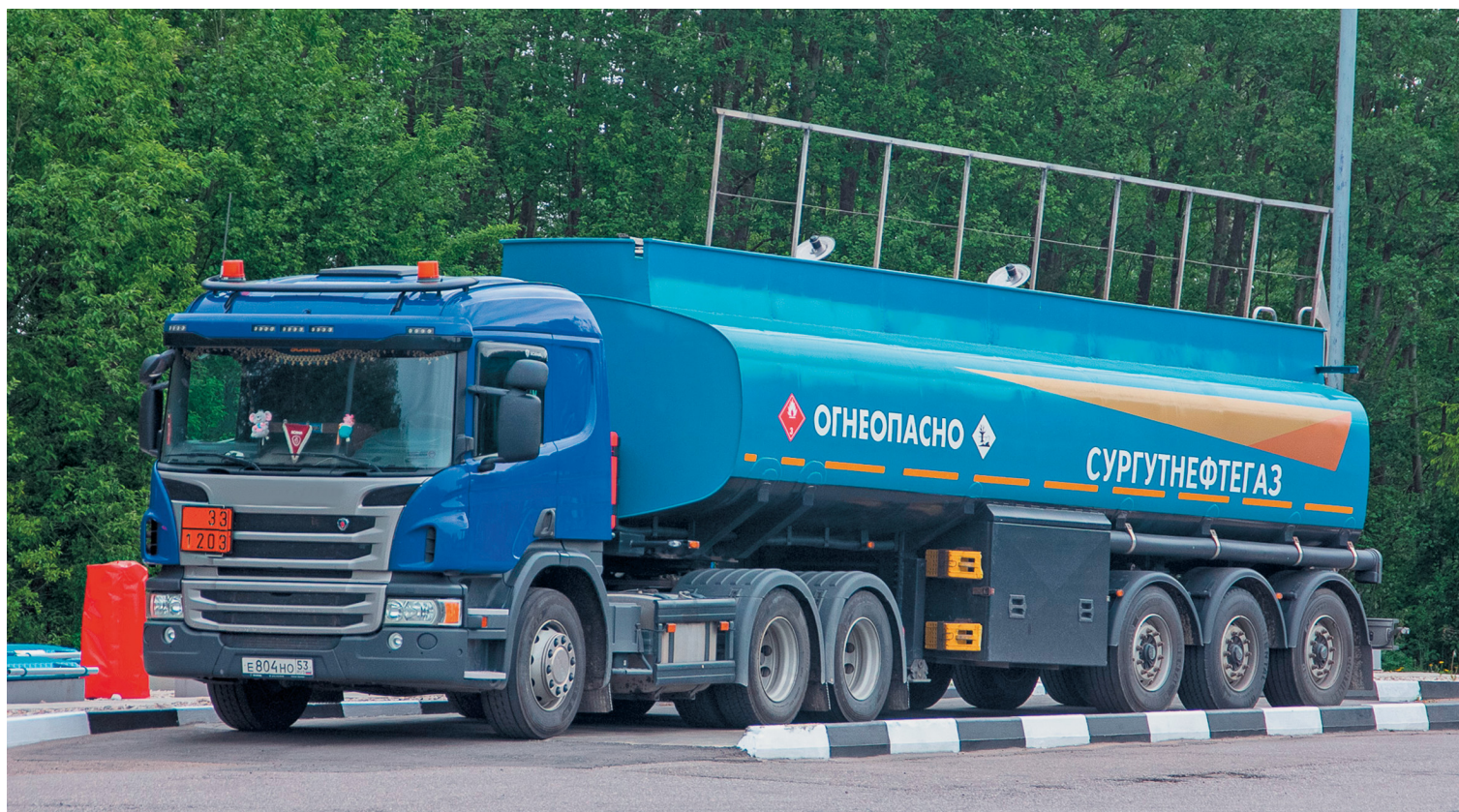
Правильность проведения технологических операций с нефтепродуктами очень важна

Миллионы автолюбителей Северо-Западного региона России ценят безупречное качество топлива на АЗС сети ПАО «Сургутнефтегаз». Многие клиенты знают производителя реализуемых там нефтепродуктов – завод ООО «КИНЕФ», который является одним из крупнейших нефтеперерабатывающих предприятий в России и единственным – на северо-западе страны. На его долю приходится около 6,6% от объёма российской нефтепереработки. Сегодня ООО «КИНЕФ» производит более 40 наименований высококачественной продукции, в том числе все виды топлива, сырьё для нефтехимической и лакокрасочной промышленности, продукты для предприятий, выпускающих бытовую химию, и для строительной индустрии.