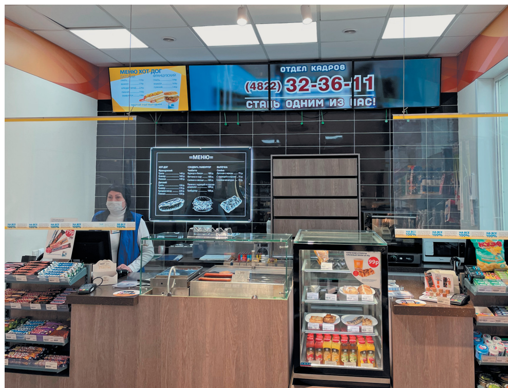
Система удалённого управления помогает сократить до нуля выезды специалистов на автозаправочные станции с целью обновления контента

В мае 2022 года на цифровой платформе появилась новая функция – «Видеостена», которая позволяет проигрывать одно расширенное видео, разделённое на несколько (2, 3, 4) ТВ-экранов. Первые видеостены были подключены 1 августа 2022 года на АЗС №4 и АЗС №1 в городе Твери. На данный момент функционал видеостены используется на 10 АЗС «Сургутнефтегаз» в Твери