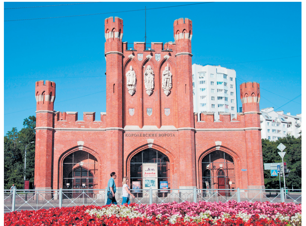
В Калининграде можно будет приобрести сувениры из других регионов

Молодые специалисты предложили продавать уникальные для каждого региона